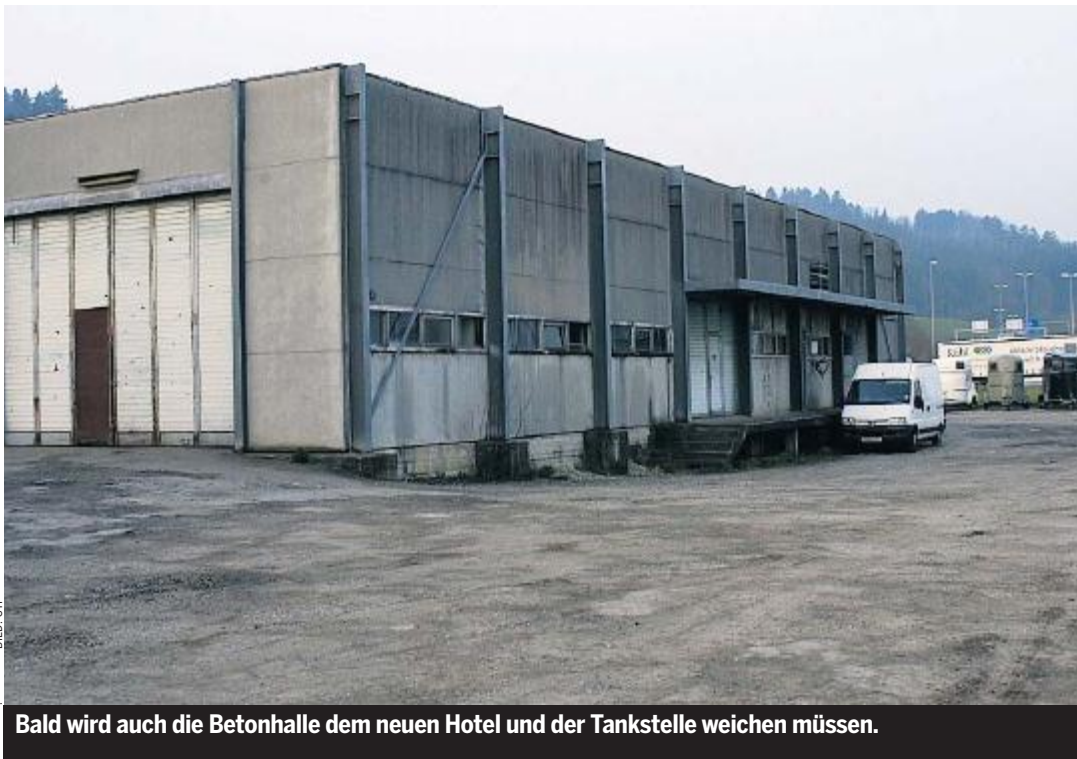
Bald wird auch die Betonhalle dem neuen Hotel und der Tankstelle weichen müssen.

Ein Geheimnis macht Alois Grüter um die neuen Mieter seines Projekts. Der CEO der Unternehmung IGD Grüter AG will partout nicht verraten, wer beim künftigen Neubau das 20 Millionen teure Hotel führt und die 4 Millionen teure Tankstelle mit Shop und Waschanlage betreibt. Das geplante 3-Sterne-Hotel soll weiter 130 Zimmer, ein Restaurant mit 200 Plätzen und mehrere Konferenzräume beinhalten. Auf Businessgäste ausgerichtet, entspricht es einem Bedürfnis, meint Grüter. Es seien namhafte und grosse Firmen, die für die Miete mündlich zugesagt hätten. Definitiv unterzeichnen sie erst im Juni/Juli, wie Alois Grüter erklärt. Ganz auf Angaben verzichten kann er aber dennoch nicht: «Einer der drei grossen Tankstellenbetreiber Migros, Coop oder Shell», dreht Grüter an der Spekulationsspirale. Und die vorgesehene Hotelkette sei international bekannt. Namen rückt er keine heraus. Das sei so vereinbart, erklärt er auf Anfrage.